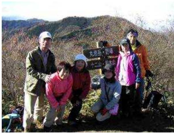
熊鷹山山頂 ( 後方は根本山 )